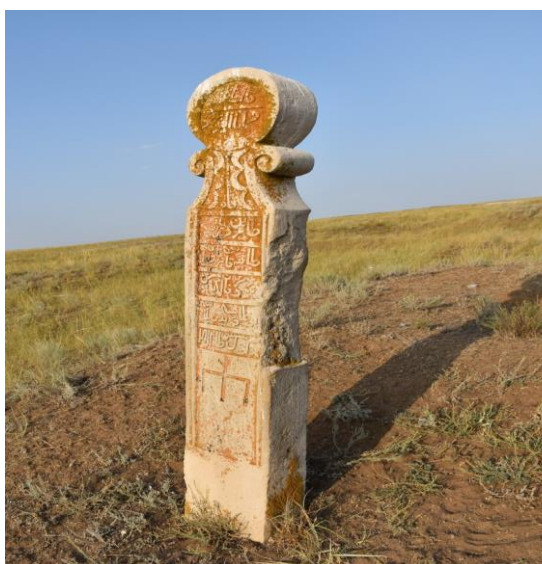
Сурет 1. Эпиграфикалық құлпытас