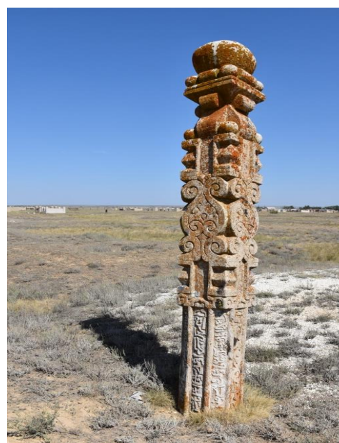
Сурет 4. Ақмола зиратының алып құлпытасы

Ақраб ауылынан шығысқа қарай 6,68 км жерде орын тепкен тағы атауы белгісіз қазақ зираты зерттелді. Зерттеу кезінде зиратқа 34 қазықша қойылды. Жалпы зират солтүстіктен оңтүстік бағытта созыла шоғырланған (жобамен 90x60 м.). Зираттың батысында 50-60 м қашықтықта археологиялық оба орналасқан. Оның қасында тағы көне тасүйме күйінде қалған үш-төрт моланың іздері жатыр. Зираттың жалпы жоспарының солтүстік жағында құлпытастар және тас қоршаулар басым. Ал, оңтүстік жағы негізінен қорғандардан тұрады. Айта кету керек, мұнда жақсы сақталған ескерткіш түрі – құлпытастар. Онда 22 құлпытас бар. Мұндағы құлпытастарды әдеттегідей екіге бөлуге болады: көпаярусты және төрт қырлы – батыс пен шығыс беті жалпақай болып келген эпиграфикалық құлпытастар. Негізінен құлпытастармен байланысқан сопақша топырақ үйінділері басымырақ. Құлпытастарда тарақты-табын, бір құлпытаста төртқара (?) руларының таңбалары бедерленген. Сонымен қатар, тас қоршаулар;