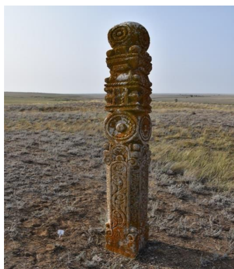
Сурет 2. Бірнеше сатылы әсем өрнекті құлпытас

кезең болса, екіншісі қазіргі заманғы бөлігі. Бейіттің көне кезеңге жататын бөлігі зираттың жалпы жоспарының ортаңғы бөлігінде орналасқан, ал қазаргі заманғы бөлігі көне бейіттің батыс, шығыс және солтүстік шығыс жағын қоршай шоғырланған. Көне кезеңге тән бөлігі негізінен тек құлпытастардан тұрады. Олардың тек төрт-бес ғана құлпытасы сақталған. Таңбалары