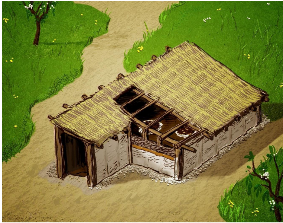
Рис. 2. Поселение Шагалалы II. Графическая реконструкция дома второго типа. Автор реконструкции Сакенов С.К., художник Меденко В.С.

Третий тип – это дома с каменными стенами. Дом прямоугольной формы с закругленными углами, стены выложены из крупных плоских камней. Торцовая стена полуовальной формы, дополнительно укреплена плоскими плитами. Вход сделан со стороны северо-восточного угла и ориентирован в сторону реки. Дом имеет выступающий длинный коридорообразный вход. Стены жилища максимальной высотой 1,75 м, размерами 6,6×3,9 м. Каменные стены возводились без раствора, камни хорошо подгонялись друг к другу. Двухскатная кровля, скорее всего, состояла из бревенчатого наката. Небольшая часть, где жилище приобретает полуовальную форму, бревенчатый накат покрывался радиально. Кровля дополнительно утеплялась ветками, для водонепроницаемости крышу могли утрамбовывать дерном и золой [8]. На основе остатков архитектурной конструкции строения нам удалось сделать его реконструкцию (рис. 3: 9). Керамический комплекс, характерный для данного дома, представлен саргаринско-алексеевским типом (рис. 3: 2, 3), импортной среднеазиатской станковой керамикой (рис. 3: 5), а также станковой керамикой местного производства, который мы идентифицируем как «станковая керамика степного типа».