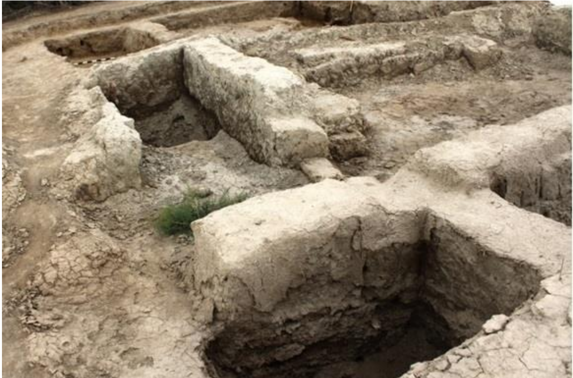
Рисунок 3. Сортобе 1. Помещения №№3, 4, 7. Вид с востока.

К северу от помещения №7 расположено помещение №5.