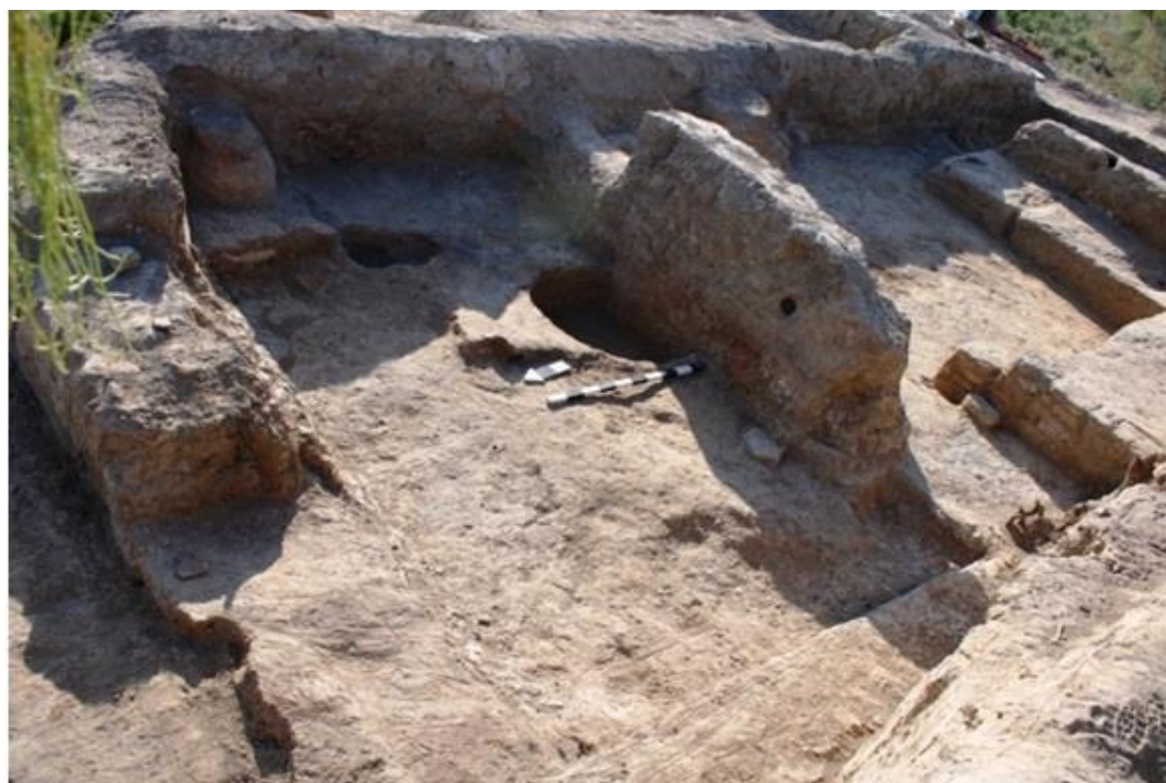
Рисунок 5. Сортобе 1. Раскоп №1. Помещение №6. Вид с запада.