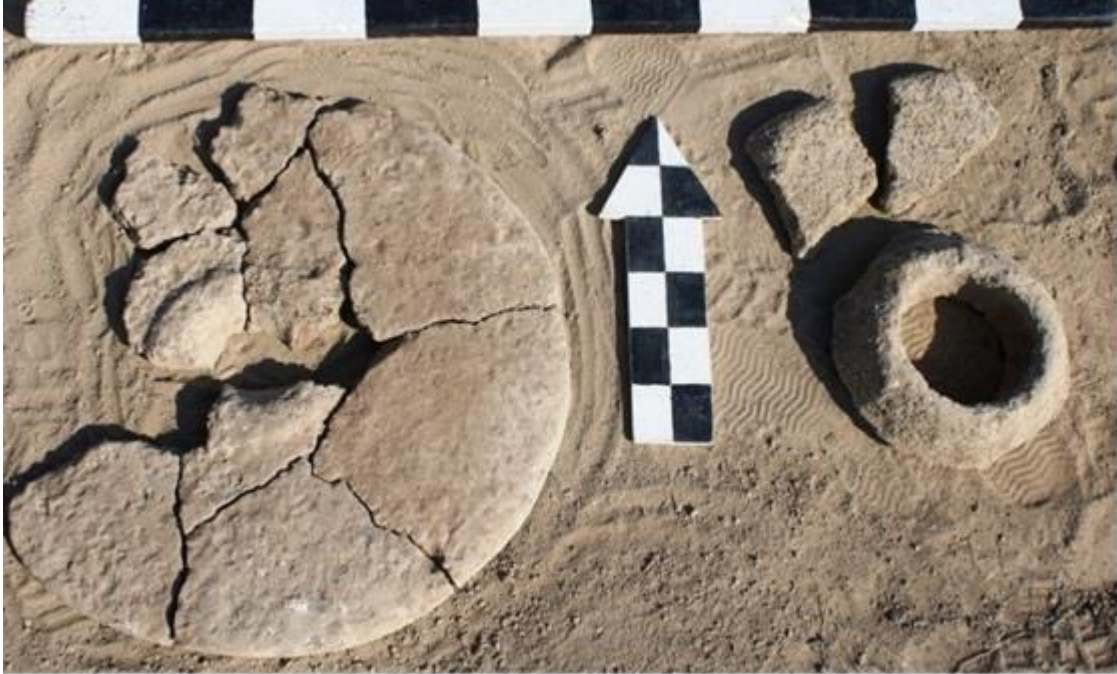
Рисунок 7. Сортобе 1. Фрагменты жернова из Раскопа №1, помещение №7.

На данном этапе археологические работы были приостановлены, и будут продолжены в следующих полевых сезонах (Рис. 8).