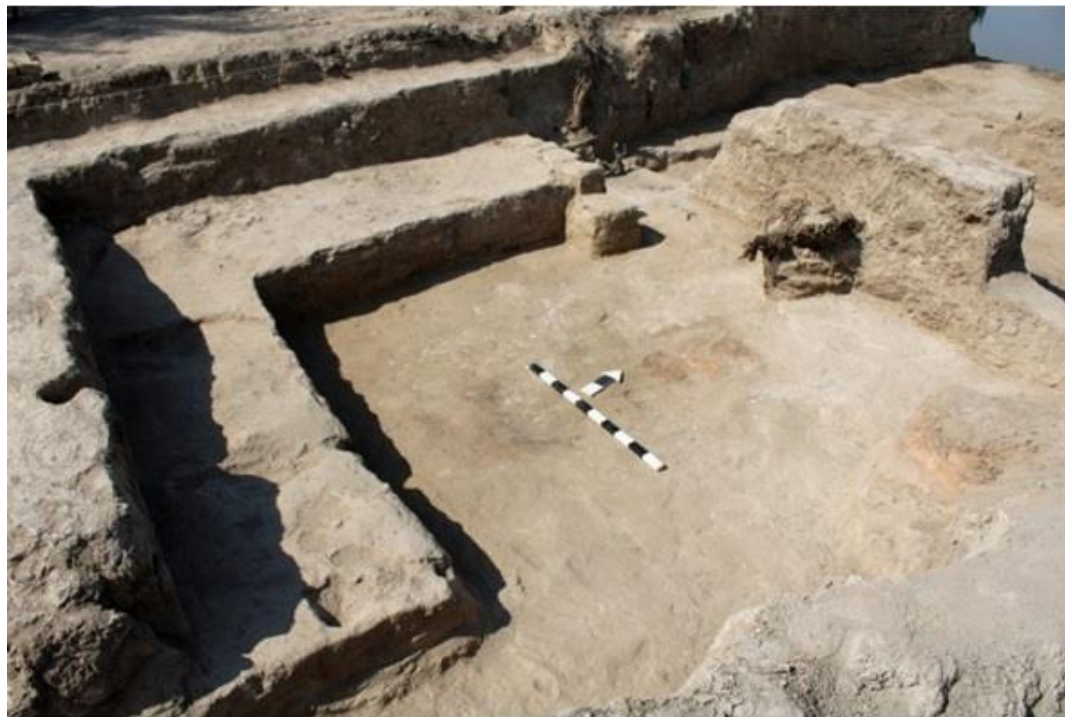
Рисунок 4. Сортобе 1. Помещение №5. Вид с востока.

Прямоугольное в плане помещение №6 размером 420 \times 220 см вытянуто по оси восток-запад. Южная стена помещения №6 длиной 340 см, ширина стены 50 см, высота стены сохранилась на высоту 90 см. В юго-западном углу проход в помещение №5. Прямо по центру южной стены расчищена яма в форме полукруга, размером 100 \times 70 см и глубиной 30 см. (Рис. 5).