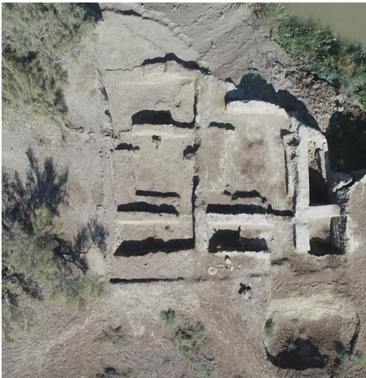
Рисунок 8. Сортобе1. Раскоп №1. Вид с птичьего полета.