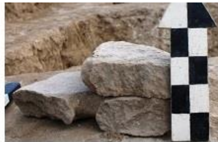
Рисунок 6. Сортобе 1. Фрагменты жернова из Раскопа №1, помещение №7.