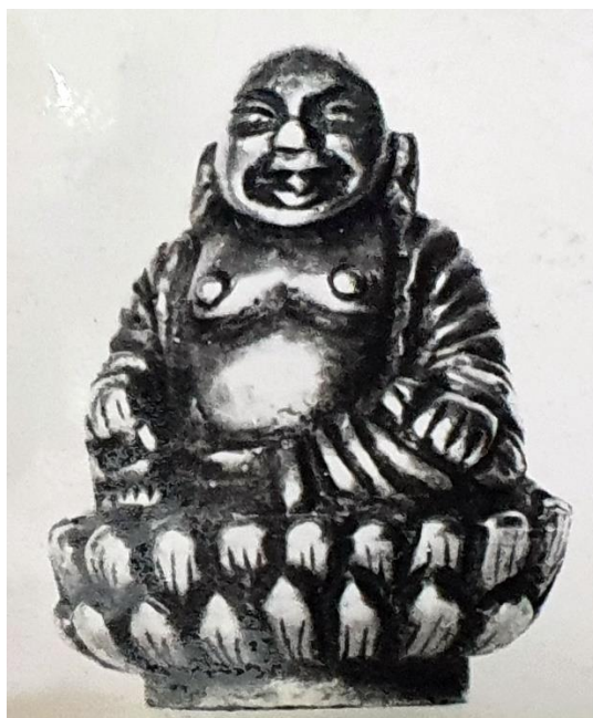
Рис. 5 Статуэтка «смеющегося» Будды, на троне из лотоса. «Дом ювелира», городище Талгар, раскопки И.И. Копылова. Вторая половина XII в. – начало XIII в.

Пожалуй, самая яркая находка, в хорошей сохранности и однозначно, относящаяся к буддийскому культу металлическая статуэтка божества – Будды, счастливого/смеющегося, восседающего на «лотосовом» троне (рис. 5). Хотэй (Хотей), Будай – Бог счастья, богатства, веселья и благополучия, а также – защитник детей. Жизнь максимально разнообразила «предназначения», смеющегося Будда, в том числе, исполняющего желания. Скульптурка отлита из цветного металла - типична для традиции буддизма и всегда присутствовала в изобразительной традиции буддизма. Он был включен в китайский даосизм как божество изобилия. Божество сидит, подогнув ноги под себя, на огромном лотосе – символе буддизма. Передняя часть тела: рельефная грудь и живот – оголены и явно демонстрируют материальное довольство и внутреннее спокойствие. Видимо, именно так в те годы представлялось «земное счастье» в сочетании с «просветлением». Подобный образ Будды был широко распространен в течении всей истории буддизма. Данная буддийская скульптурка стала бы украшением любого музея, но, к сожалению, была утеряна. Ее принадлежность к материалам раскопа № 7 на городище Талгар восстанавливается по фото и упоминанию находок в этом раскопе. Данными о нынешнем местонахождении этих находок мы не располагаем, к сожалению, как и о значительном числе других находок из раскопов на городище Талгар, совершенных с 1955 по 1989 гг. экспедицией на городище Талгар, руководимой И.И. Копыловым (Копылов, 1978).