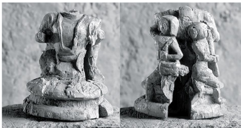
Рис. 3 – Фигурка Будды, из кости. С тыльной стороны вырезаны две человеческие фигуры: барабанщика и с древком. «Дом ювелира», городище Талгар, раскопки И.И. Копылова. Вторая половина XII в. – начало XIII в. (По: Байпаков, Ерофеева, 2019: с. 24, рис. 16).