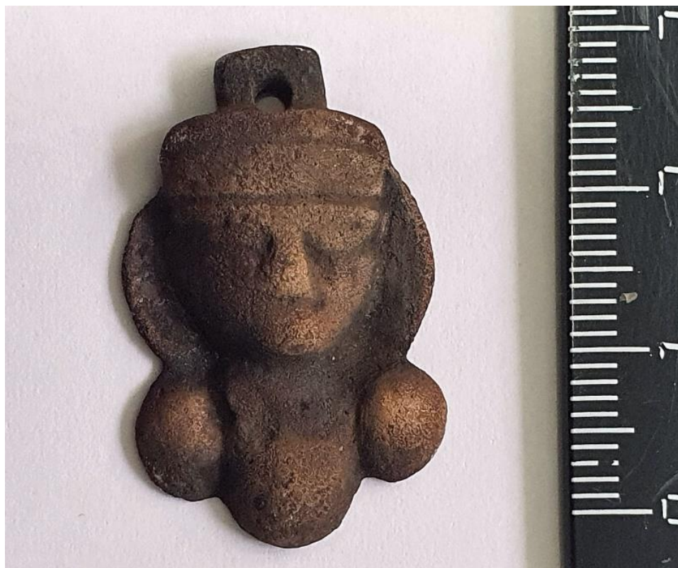
Рис. 1 – Бронзовая буддийская подвеска, VIII – X вв. Случайная находка на городище Актобе (Казахстан).