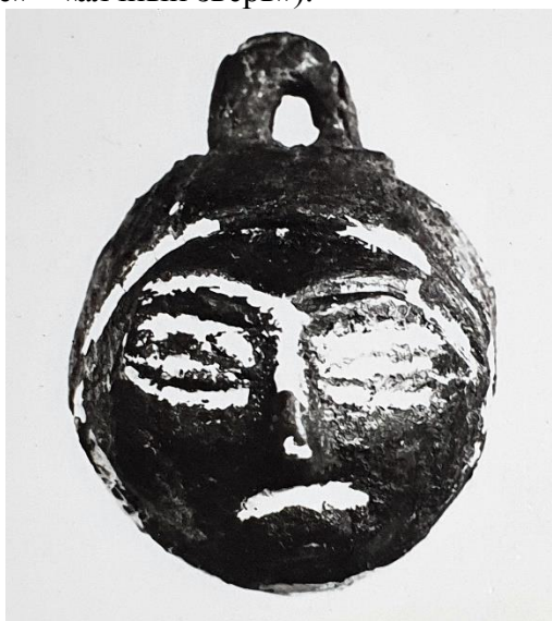
Рис. 4 – Подвеска нательная, из цветного металла. «Дом ювелира», городище Талгар, раскопки И.И. Копылова. Вторая половина XII в. – начало XIII в.