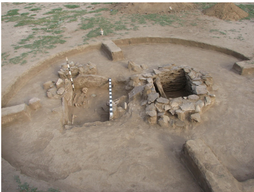
Рис. 2. Могильник Ондирис 2. Погребальные конструкции (каменный ящик и циста) бронзового века.

Приведем еще один пример вторичного захоронения, когда раннесакские племена использовали готовые погребальные сооружения бронзового века. Таким ярким образцом является могильник Онырыс II, находящийся на территории села Ондырыс Астраханского района Акмолинской области. Памятник расположен на правом берегу реки Ишим, на поверхности мысов второй надпойменной террасы. Река в этом месте имеет широкую пойму (Сакенов, 2019: 295). На территории исследована каменная ограда, состоящая из двух погребальных камер. Правая погребальная камера — это каменный ящик, составленный из крупных плоских плит. У левой цисты стены могильной ямы выложены из плоских плит, уложенных плашмя.