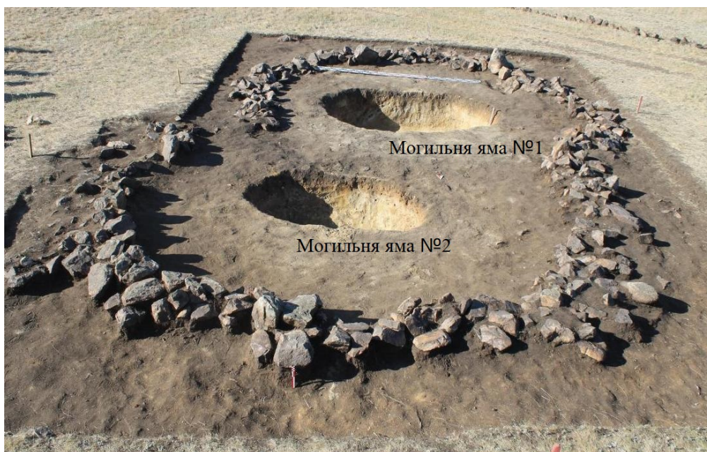
Рис. 3. Могильник Шагала V. В могильной яме № 1 исследовано мужское погребение раннесакского времени. В могильной яме № 2 – женское погребение древнетюркского времени [Fig. 3. Shagalaly V burial ground. In burial pit No. 1, a male burial of the early Saka period was investigated. In burial pit No. 2, a female burial of the ancient Turkic period was found.]