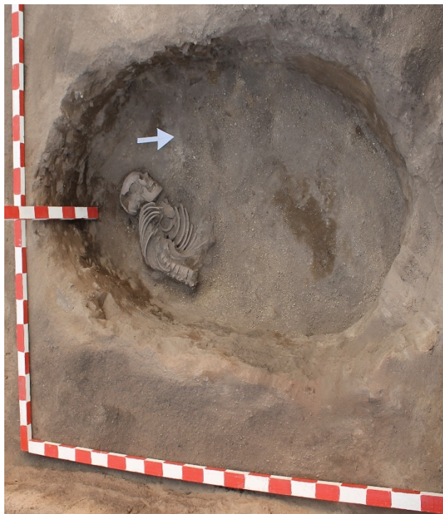
Рис. 1. Поселение Шагалалы II, погребение № 1. Вторичное захоронение [Fig. 1. Settlement Shagalaly II, burial No. 1. Secondary burial]

Анализируя вышеуказанные археологические данные, можно представить череду прошлых событий и предложить следующую гипотезу. В рамках указанного хронологического времени в изучаемом регионе произошли необратимые изменения, которые, скорее всего, привели к локальным военным столкновениям. Представители племен, пришедших на эту землю извне, являются чужеземцами. Они использовали расположенные на местной территории погребальные сооружения: расчищали готовые могильные ямы, костяки ранее погребенных выкидывали и в этих пригодных погребальных камерах хоронили своих сородичей. Такие поступки свидетельствуют о том, что эти пришлые люди не считали ранее погребенных своими предками.