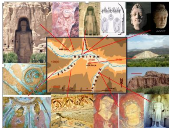
Рисунок 3 – Археологические памятники города Бамиан

Бамианская долина расположена в центральной части Афганистана, менее чем в 200 км северо-западнее Кабула. В долине находится современный город Бамиан – центр одноимённой провинции Афганистана. Долина представляет собой единственный удобный проход через Гиндукуш, поэтому издревле служила торговым коридором. Во II веке здесь возникли буддийские монастыри. При царе Ашоке было начато строительство гигантских статуй, завершившееся только через двести лет. В V веке китайский путешественник пишет о десяти монастырях, которые населяли тысячи монахов. Обширные пещерные комплексы, вырубленные в скалах, служили постоянными дворами для паломников и торговцев. В XI веке долина была присоединена к мусульманскому государству Газневидов, однако буддийские святыни тогда не были разрушены. В долине вырос город Гаугале, украшенный прекрасными мечетями. В 1221 году войска Чингисхана разрушили город и опустошили долину. В средневековье комплекс буддийских монастырей в Бамианской долине получил название Кафиркала – город неверных.