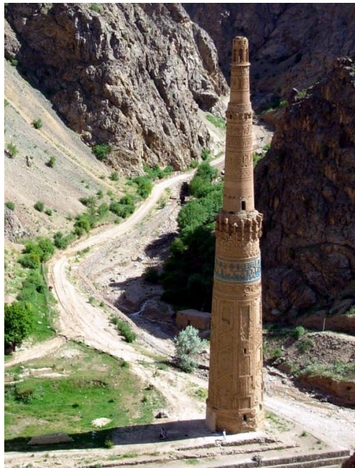
Рисунок 1 – Джамский минарет.

Джамский минарет является единственной уцелевшей постройкой древнего города Фирузкух, который был столицей султанов династии гуридов, до переноса её в Газни. В 1221 году город Фирузкух был разрушен войском Чингисхана и даже место его расположения было надолго забыто. Ущелье окружают непроходимые горные массивы. Крупные населённые пункты в районе отсутствуют. Расстояние до Герата – 200 км. Минарет был построен в 1194 году гуридским султаном Гияз-ад-Дином в честь окончательной победы над газневидами в 1192 году. Об этом написано в самом минарете.