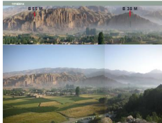
Рисунок 2 – Бамианские статуи Будды.

Бамианские статуи Будды (пушту د باميانو بودايي پژي də Bāmyāno būdāyī raḡəy, дари بت‌های بودا در بامیان bothāy-e būdā dar Bāmyān, дари تندیس‌های بودا در بامیان tandīshāy-e būdā dar Bāmyān) – две гигантские статуи Будды (55 и 37 метров), входившие в комплекс буддийских монастырей в Бамианской долине.