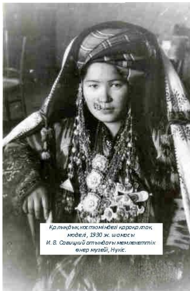
Қрлықдық костюміндегі қарақалпақ модель, 1930 ж. шамасы И. В. Савицкий атындағы мемлекеттік өнер музейі, Нүкіс.

осы халықтардың географиялық және мәдени жақындығы ықпал еткені айтпаса да түсінікті. Алдымен ұлттық киімдерден бастасақ, қарақалпақтарда Ұлттық киім үлгілері тек үлкен буын өкілдерінде көрінді. Көне қарақалпақ киімдері өте сәнді, әсіресе әйелдердің бас киімдері мен жамылғылары алуан түрлі болды. Көне қарақалпақ киімдерінің жұрнағын тек қазіргі әйел көйлектерінен ғана байқауға болады [14].