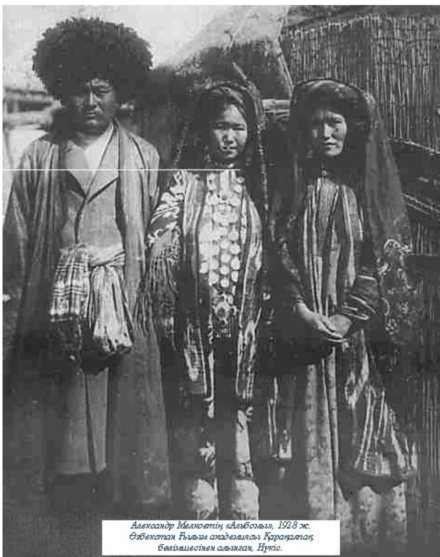
Александр Мелюевтің «Альбомы», 1928 ж. Өзбекстан Ғылым академиясы Қарақалпақ бөлімшесімен алынған, Нұрғис.

Қазақстан Республикасында мекендейтін халықтар өз теңдігі мен принциптерін берік ұстанады. Олар өз ұлттық болмысы мен мәдениетін берік сақтаған және бұл жолда оларға Қазақстан билігі аса үлкен көлемде ықпал етуде. Ұлттық ерекшеліктерін сақтап қалу мақсатында Қазақстанның барлық аймақтарында ұлттық-мәдени орталықтар құрылып жұмыс істеуде. Олардың ең бастысы – Қазақстан халықтар Ассамблеясы.