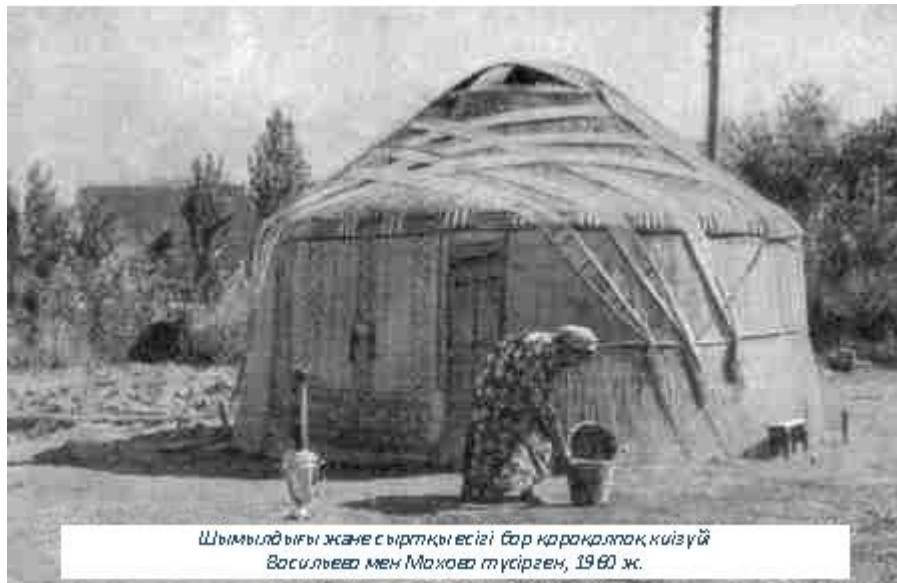
Шымылдығы және сыртқы есігі бар қарақалпақ киіз үй, 1960 ж.

Киіз үйдің ағаш бөліктерін жасайтын шеберді үйші деп атады. Халық түсінігінде олардың Ибрахим Халил (ең алғашқы киіз үйді жасаушы) деп аталатын қоғаушы пірі болды. Үйді жасауды бастар алдында шебер піріне дұға жасайтын. Үйшілер көбінесе бес, алты, жеті қанатты киіз үйлерді жасады [13].