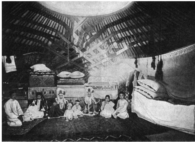
Сурет 4 - Бай қазақтың отбасы. Қазалы уезі. XIX ғасырдың соңы. М.В.Лавров түсірген [14].

Кунскамера фотоқорындағы қазақтар бейнесі. Қазақ халқының дәстүрлі этнографиясына қатысты фотодеректердің мол қорының жинағы Санкт-Петербургтегі Ұлы Петр атындағы Антропология және этнография музейі (Кунскамера) екені анық. XIX ғасырда қазақ жерінің толығымен Ресей империясының ортақ иелігіне айналуы себепті, патша үкіметі жергілікті