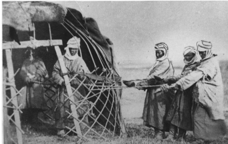
Сурет 5 – Арқан есу. Түркістан альбомы. [20].

«Түркістан өлкесі халықтарының этнографиясы» деп аталатын альбомның 3-ші томы да 2 альбомнан тұрады. Альбом Орта Азияда тұратын жергілікті халықтардың дәстүрлі тұрмыстық баспанасынан, тұрмыстық бұйымдарынан, киім-кешектерінен, әдет-ғұрыптарынан, халық тығыздау орналасқан аймақтардан мәлімет береді. 478 фото жапсырылған 176 картонды қамтыған. Альбом мазмұнындағы тәжіктер, сарттар, өзбектер, қазақтар, қырғыздар, индустар, арабтар, еврейлер, ауғандар, ирандар, цығандар бет-бейнесі берілген фотолар олардың тек антропологиялық типін ғана емес, өлке халқының этникалық құрамын анықтауға да маңызды дерек береді. «Халық тығыз орналасқан аймақтар» деп аталатын альбомда Әулиеата, Жизақ, Ташкент, Түркістан, Ұратөбе, Шымкент т.б. қаладағы халықтардың дәстүрлі тұрмысын көрсетеді. Әсіресе Сырдария және Арыс бойы, Сырдария облысы деген бөлімдер көшпелі және отырықшы қазақтардың тұрмыс-тіршілігінің бітім-болмысын береді.