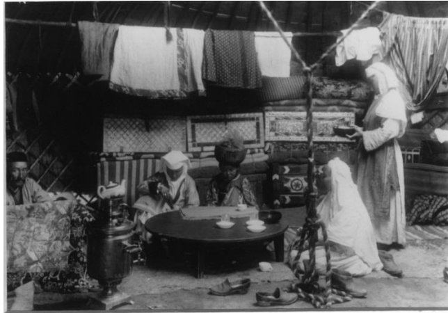
Сурет 3 - Бай қазақтың отбасы. Киіз үйді дауыл көтеріп кетпес үшін шаңырақтан арқан тартып қазыққа байлау. XIX ғасырдың соңы [1, I, с.156; 12].

Этнограф ғалымдар үшін тарихи дәуірлерден келіп жеткен заттай деректер, жазба деректер, визуалдық деректер, наротивтік құжаттар зерттеу нысанасындағы халықтың тіршілігіндегі байырғы дүниетанымның іздерін, олардың біз зерттеп отырған кезеңдегі сақталу, синтезделу жолдарын ғылыми талдауға негіз болады. Мысалы, «Азиатская Россия» кітабына енген киіз үйдің ішінен түсірілген суретте қазіргі кезде тек Сыр төменгі ағысы бойында өте сирек болса да кездесетін киіз үйді дауыл төңкеріп кетпес үшін шаңырақтан қазыққа байлайтын «бастырықты» көруге болады [1, I, с.156; Сурет 3].