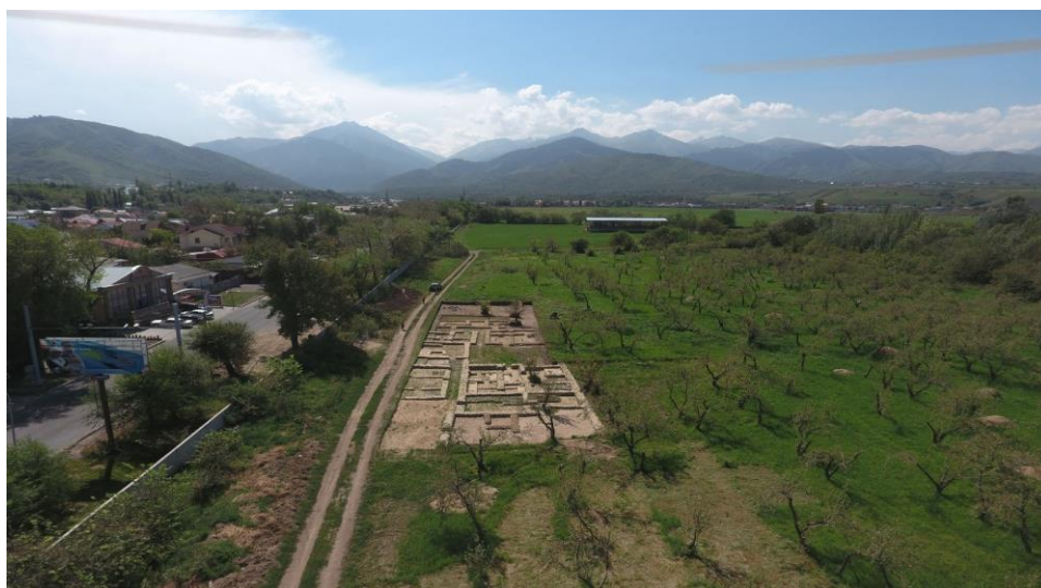
Рисунок 2. Поселение Алмарасан. Раскоп жилого массива. III в.

В эпоху саков район Алматы стал местом обитания сакских и позднее усуньских племен. От этого времени оставались многочисленные курганные могильники, среди которых выделялись огромные курганы знати – «сакских царей». Такие курганы поднимались в XIX начале – XX в. среди одноэтажных домиков старой Алма-Аты, но сейчас почти все они нивелированы и застроены многоэтажными домами. Сохранился лишь Боролдайский могильник в северо-западной части города. Под курганами в гробницах хоронили сакских царей и знать в богато украшенных одеждах. О роскоши захоронений свидетельствуют материалы из раскопок кургана Исык (Акишев, 1978). В предгорной полосе Заилийского Алатау зафиксированы десятки поселений. Наиболее известно поселение Алмарасан в западной части Алматы (Рисунок 2).