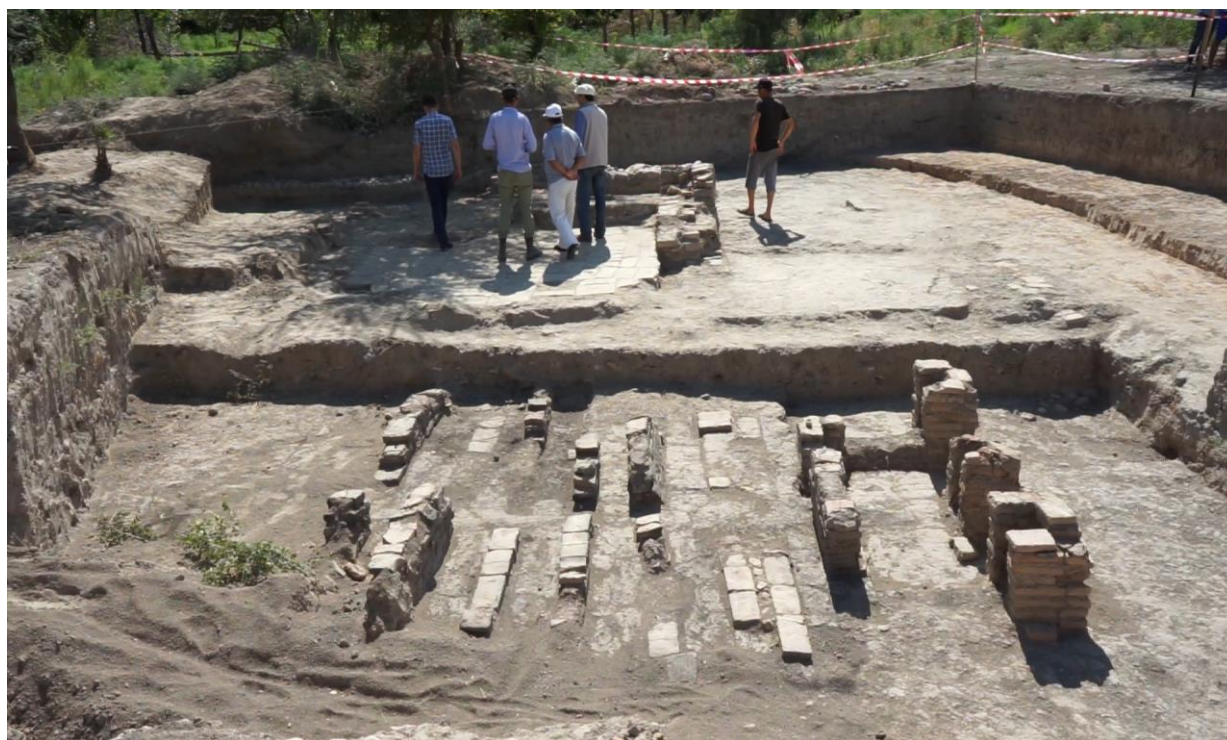
Рисунок 5. Город Иланбалык. Раскопки бани.

Но лишь в 2014 году появились новые материалы, которые позволяют более уверенно высказаться в пользу тождества города Иланбалыка и городища Учарал (Рисунок 5).