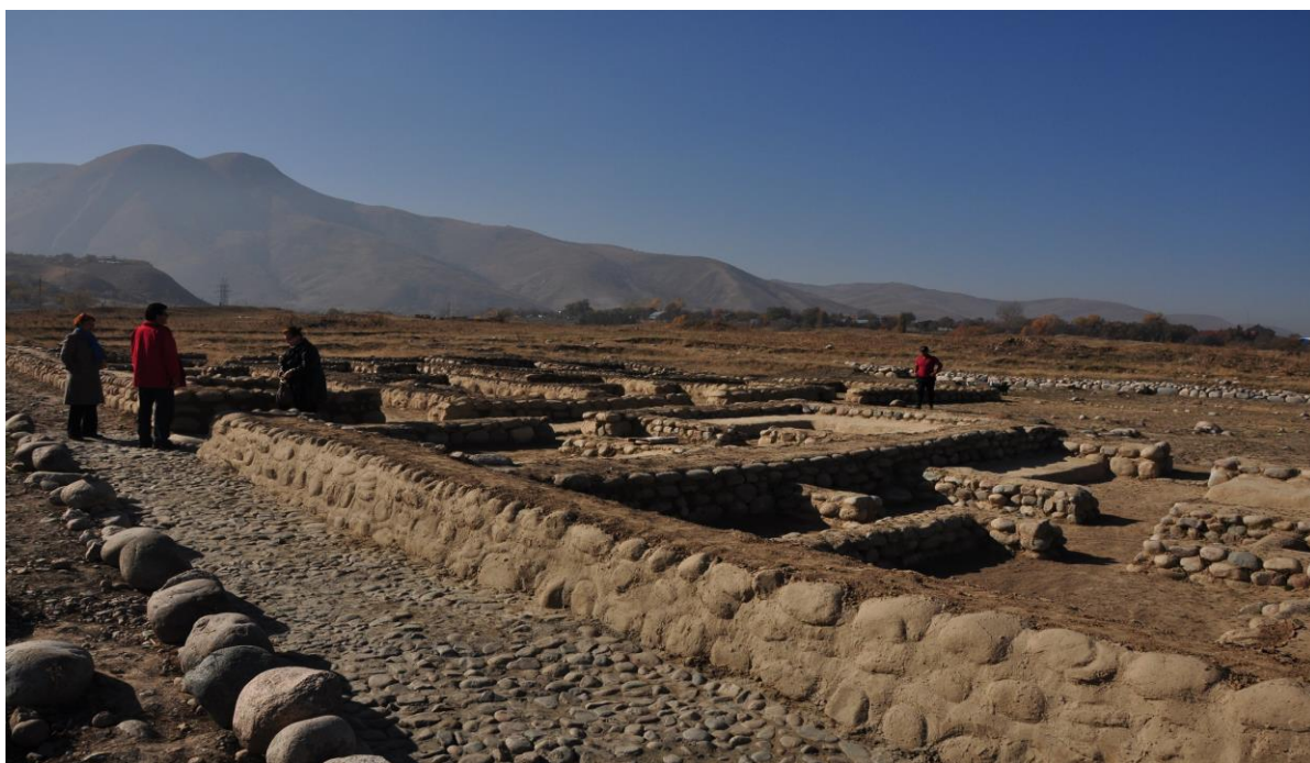
Рисунок 3. Талгар Жилой квартал. Реконструкция планировки жилых домов и интерьера жилых помещений. XI - нач. XIII в.