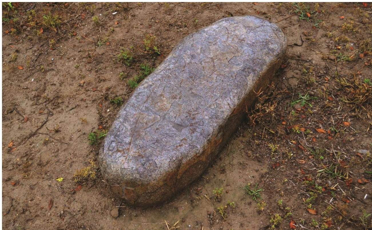
Рисунок 6. ИланбалыкКайрак из Учарала 1

Во-вторых, на городище найден кайрак – надгробный камень с несторианским крестом и надписью (Рисунок 6), которая пока не расшифрована. Это интересно еще и тем, что несторианские кайраки найдены и на Алмалыке (Байпаков, Савельева, Петров, 2015).