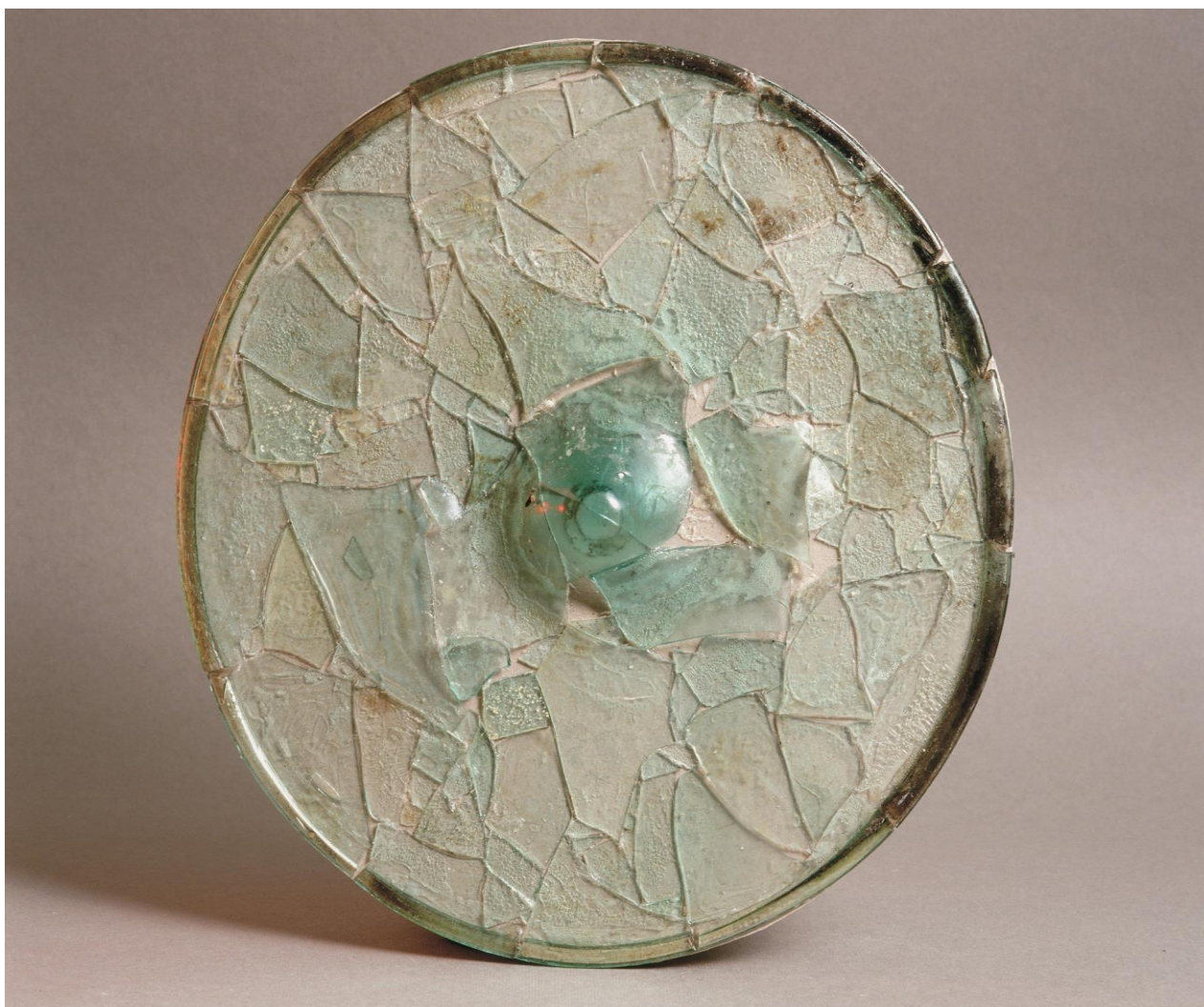
Рисунок 4. Оконный диск. Каялык. XIII в.

На городище вскрыты «богатая усадьба» и усадьбы рядового населения, отапливаемые системой дымоходов-канов. Они сооружались из сырцового, а также жженого кирпича. Для освещения помещений служили окна круглой формы (Рисунок 4), в которые вставлялись стеклянные оконные диски разного диаметра и разных цветов.